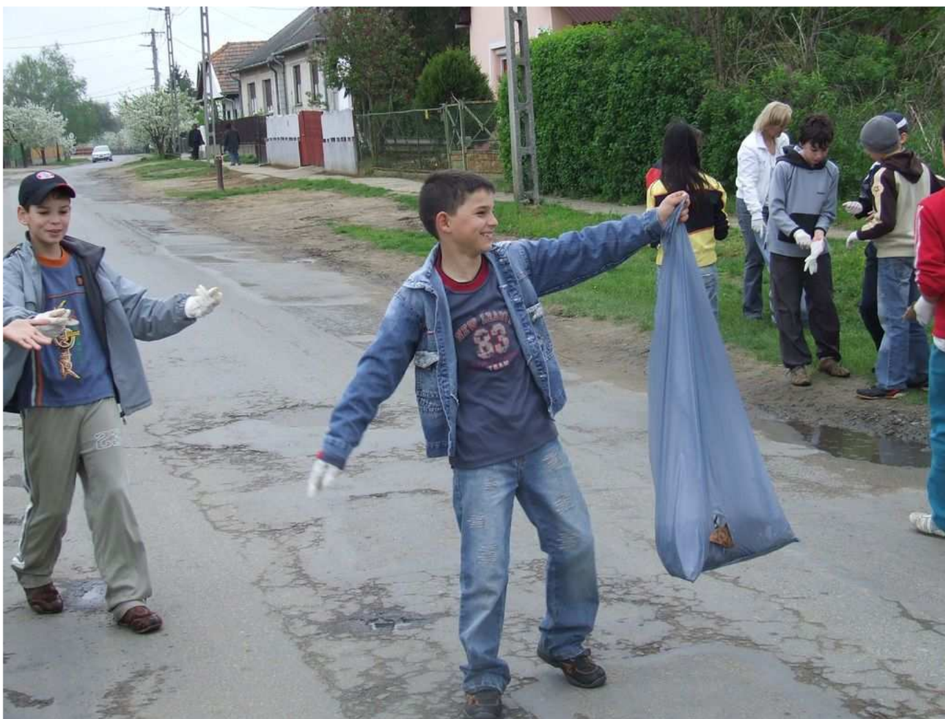
Szemétyűjtés a községben