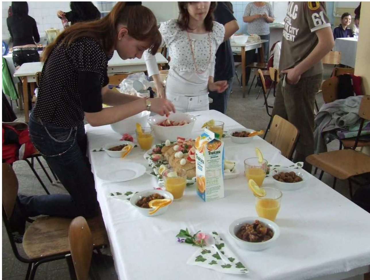
Terülj, terülj asztalkám...