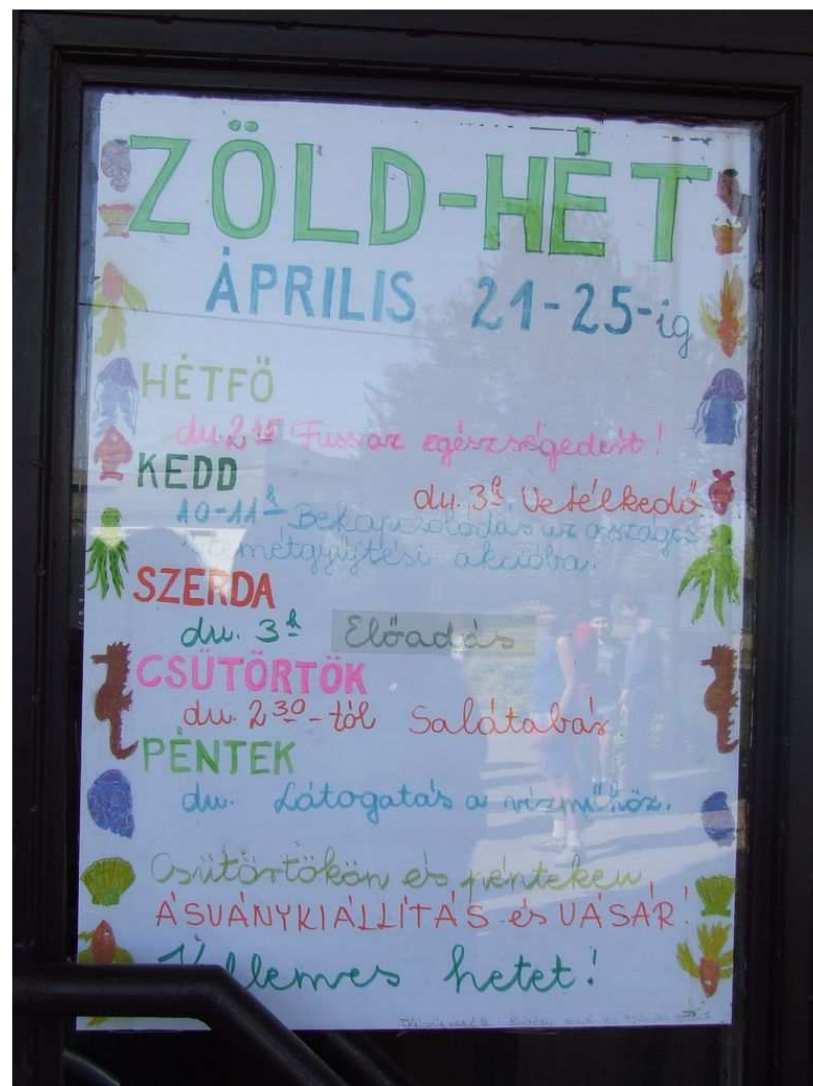
A hét programja