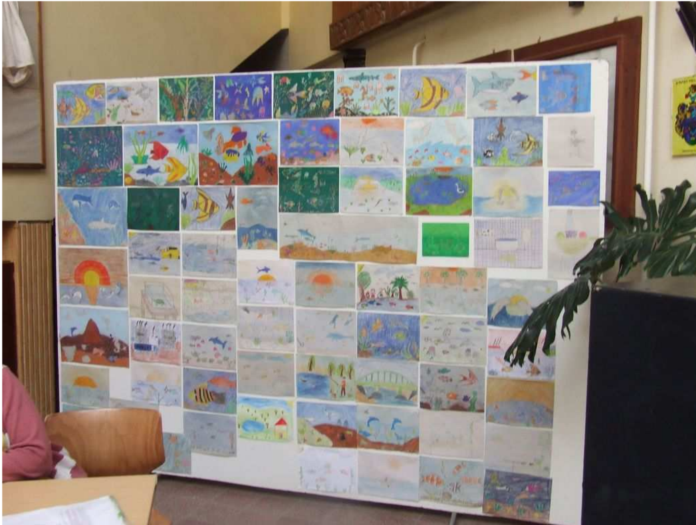
Kiállítás az elkészített rajzokból