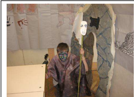
Ez a barlang lakható