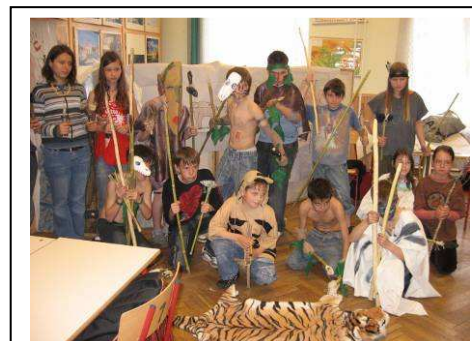
Több törzs együtt...