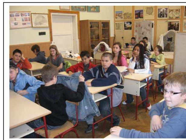
Fáradtan, de elégedetten...