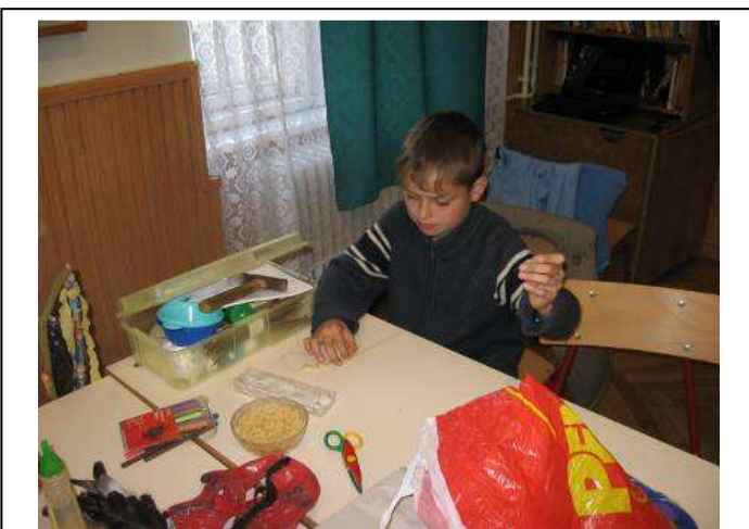
Hogy is csinálják a lányok?