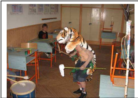
Táncol a sámán