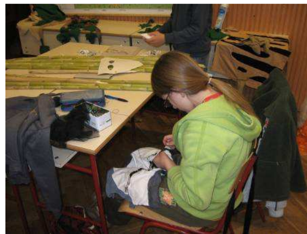
Készül a ruha...