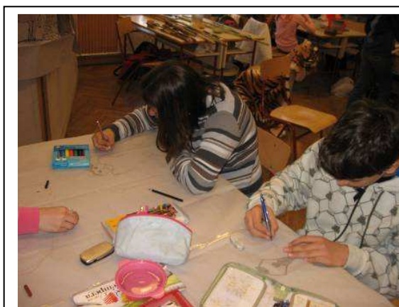
Készül a barlangrajz...