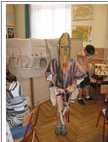
Egy igazi sámán