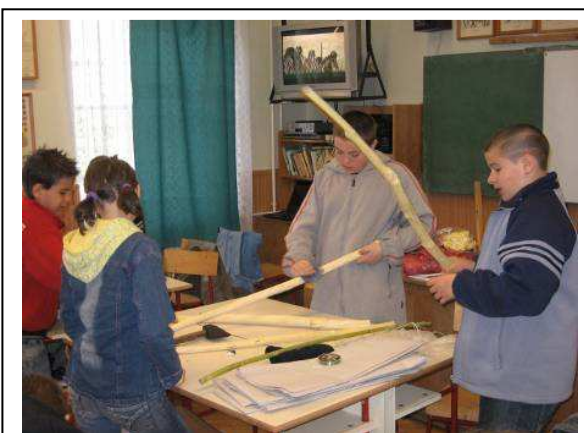
Mit lehet kihozni a bambuszból?