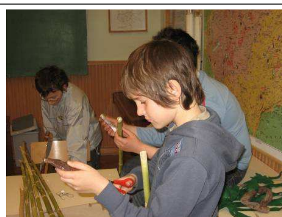
Készülnek a szerszámok és a fegyverek