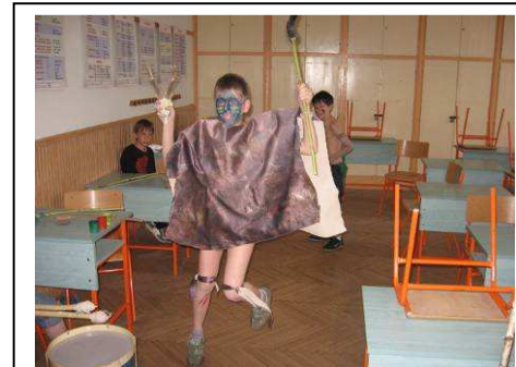
Egy másik sámán extázisban