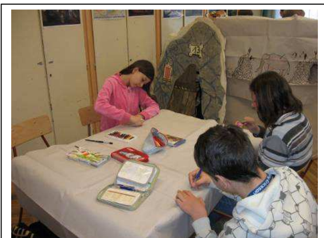
Indul a munka...