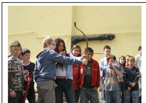
Nemcsak a fiúkat érdekli...