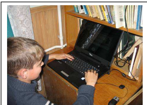
Mit is tanultunk az őskorról?