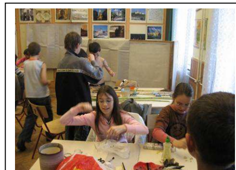
Amíg készül a fegyver, készül a nyaklánc