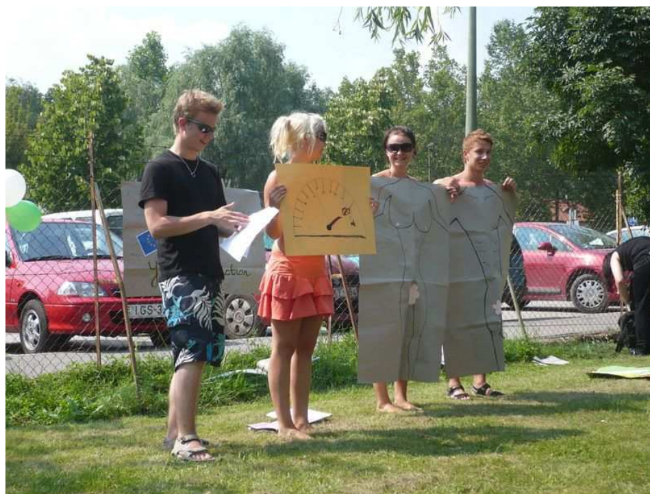
7. Drámafesztivál – a finnek szaunázás közben