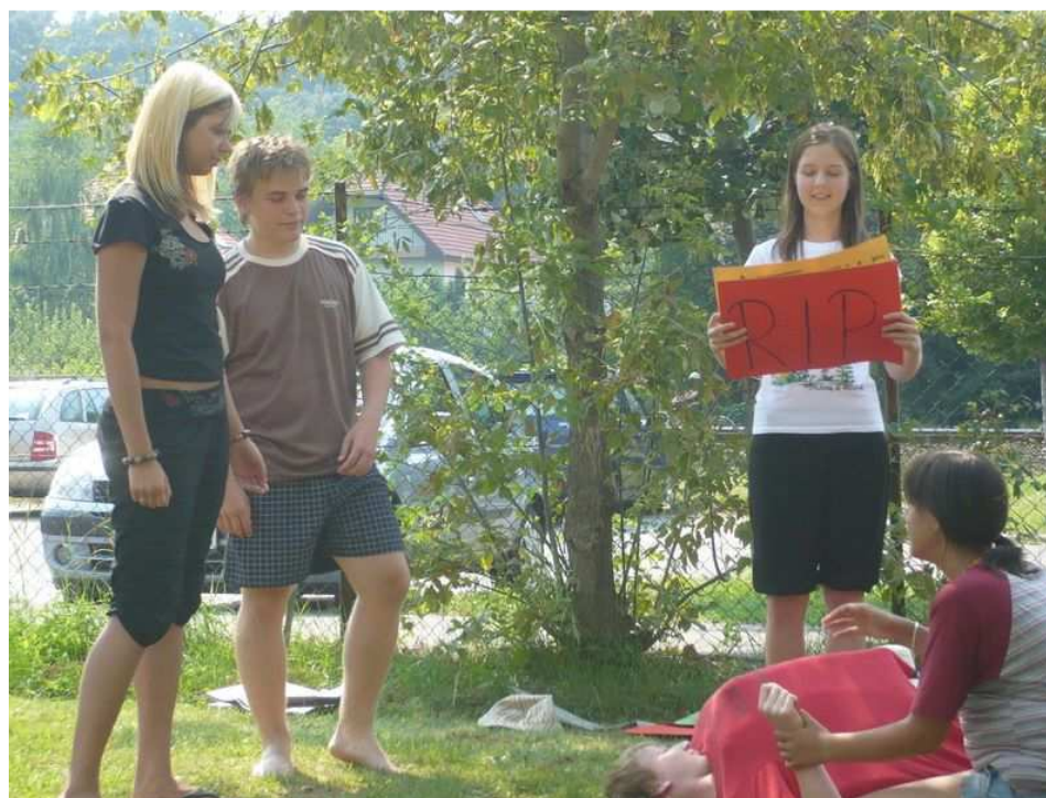
6. Drámafesztivál – a magyar csoportnak egy a táplálkozási zavarokról szóló szerepjáték