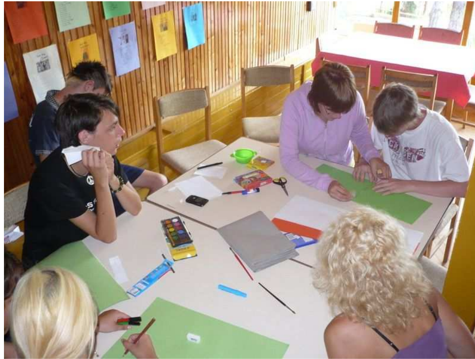
4. Előkészületek a drámafesztiválra