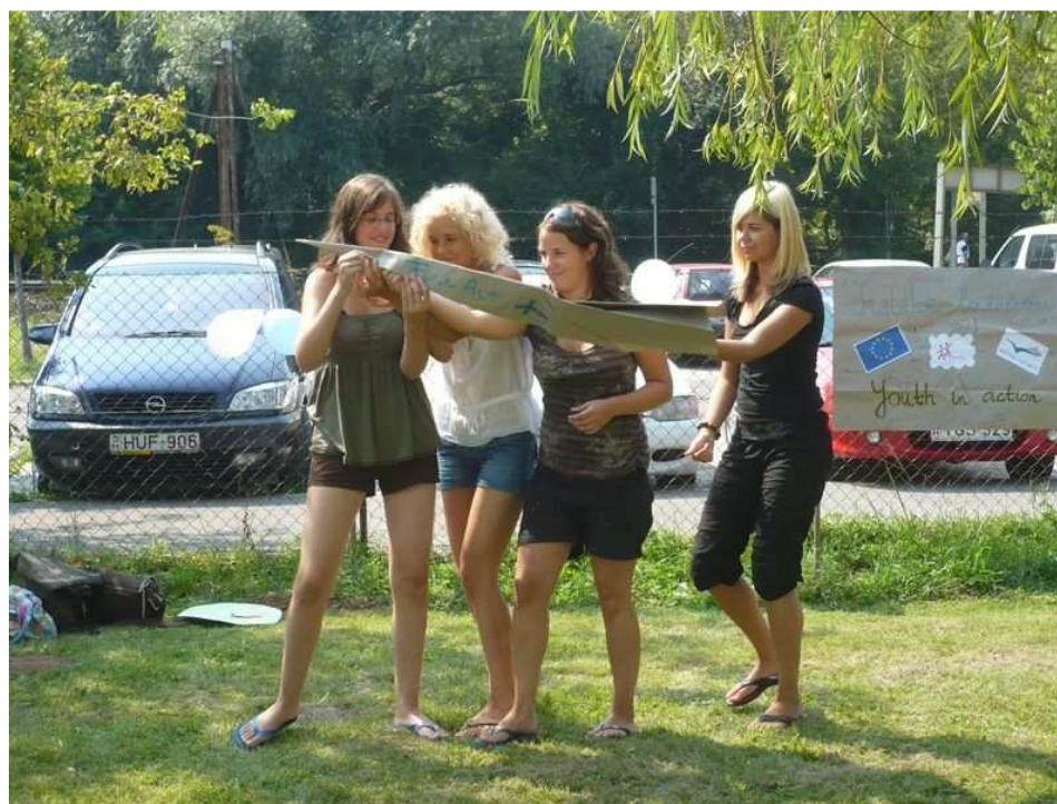
5. Drámafesztivál – a magyar csoport finnként itt éppen Magyarországra repül