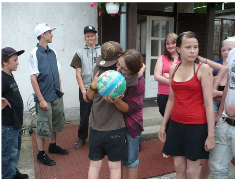
8. Búcsú :(