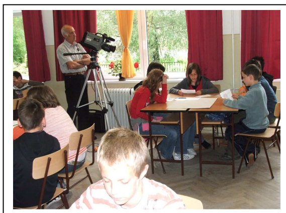
Még felvétel is készült rólunk