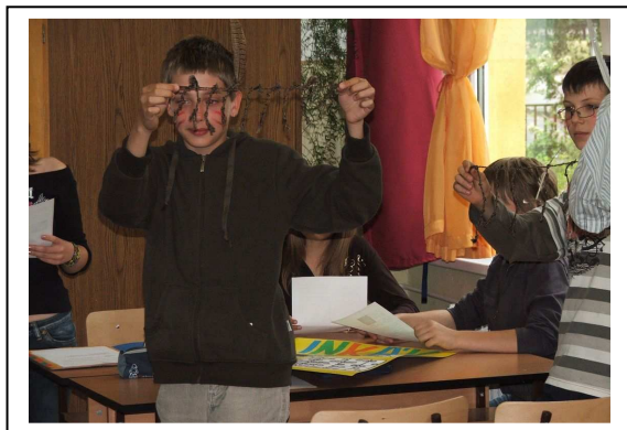
Így nézhetek ki az inkáknál a kipuk