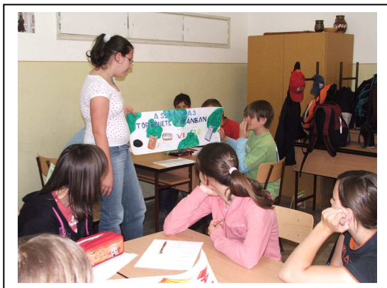
Izgalom a kezdeteknél