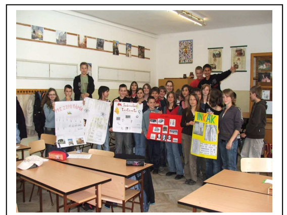
A végén felszabadultan